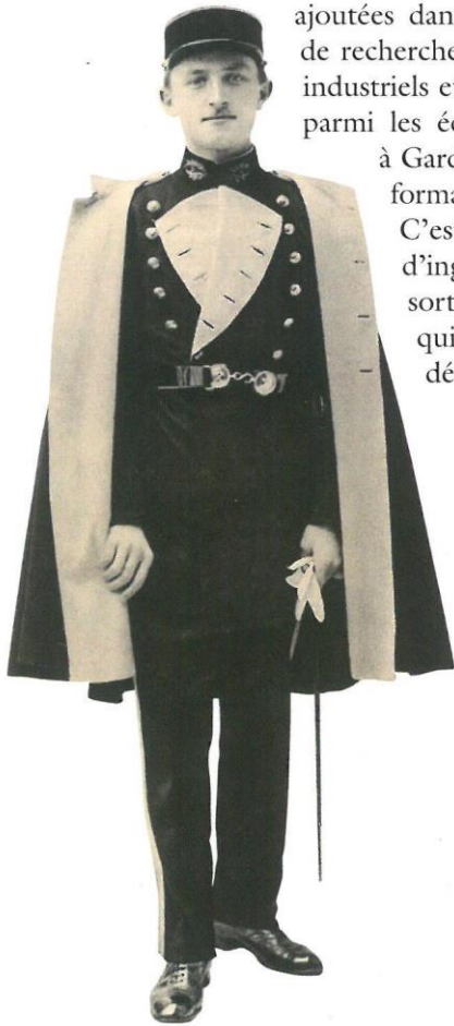
Un élève en grande tenue, photographie non attribuée, 1930.

C'est depuis 1890 que l'École délivre le diplôme d'ingénieur civil des Mines, devenu depuis lors une sorte de trade mark de la formation stéphanoise, qui, malgré la « fin des houillères », est encore délivré aux diplômés.