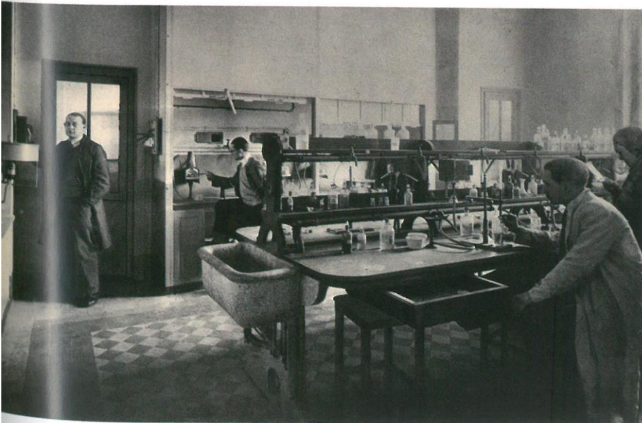
Laboratoire de l'École des mines, photographie non attribuée, 1930. Extrait de L'École nationale supérieure des mines de Saint-Étienne , album édité par la Société amicale des anciens élèves de l'École. © Association des ingénieurs civils des Mines de Saint-Étienne

Créée par l'ordonnance royale du 2 août 1816, l'École nationale supérieure des mines de Saint-Étienne peut être considérée comme la première école d'ingénieurs civils en France. À la différence de l'École des mines de Paris, sa création n'était pas liée au recrutement dans un corps d'état. Différemment aussi de l'École centrale des arts et manufactures, fondée en 1829, elle est depuis toujours une école publique et sa formation a été longtemps gratuite. Cette école a instauré un dialogue inédit entre État et industrie, dont est issue une partie non négligeable de la classe dirigeante de l'économie